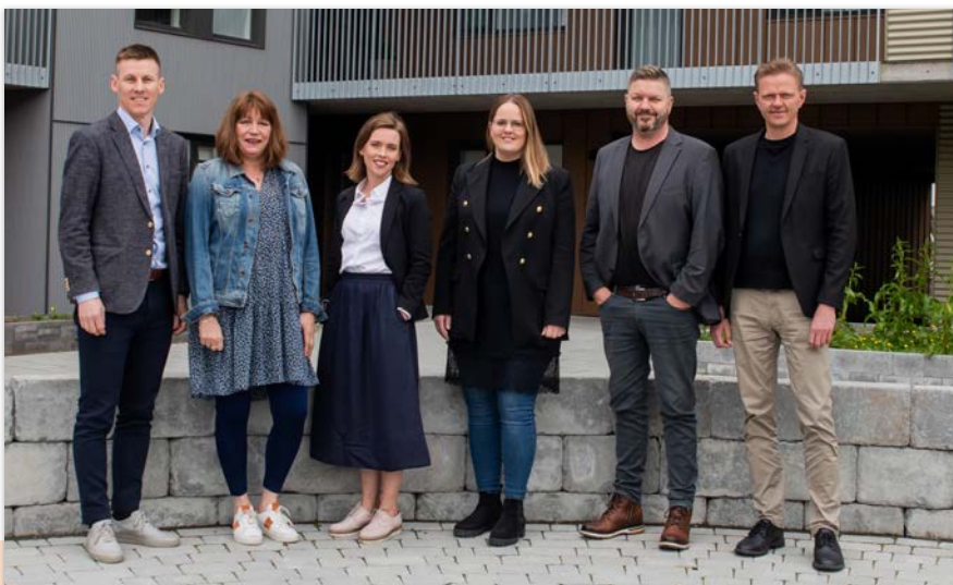
Verkefnisteymi SOS og Heimstaden á Íslandi.

Styrkur Heimstaden fjármagnar einnig þrjú erlend verkefni í þágu barna sem eru á ábyrgð SOS á Íslandi. Það eru atvinnuhjálp ungmenna í Sómalíu og Sómalílandi, baráttuverkefni gegn kynferðislegri misneytingu á börnum í Tógó og fjölskyldueflingu í Rúanda.