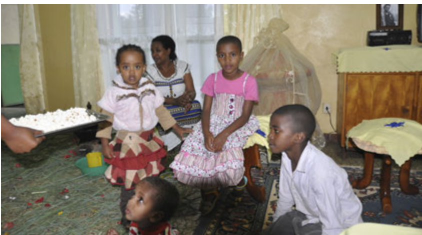
Hluti barnanna á heimilinu ásamt SOS móður þeirra.

*Nafni stúlkunnar hefur verið breytt vegna persónuverndar.