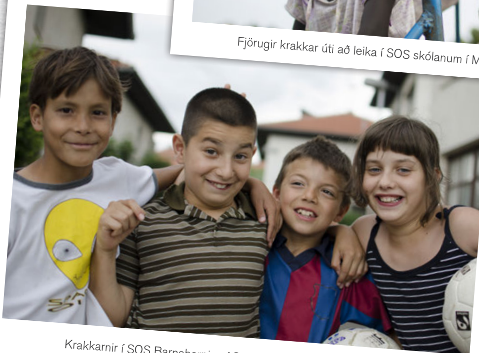
Krakkarnir í SOS Barnabörpinu í Sarajevó í Bosníu og Hersegóvínu tóku sér pásu frá boltaleiknum fyrir ljósmyndarann.