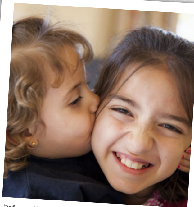
Það er gott að eiga góða systur! Þessar flottu systur búa í SOS Barnaborpinu í Damaskus í Sýrlandi.