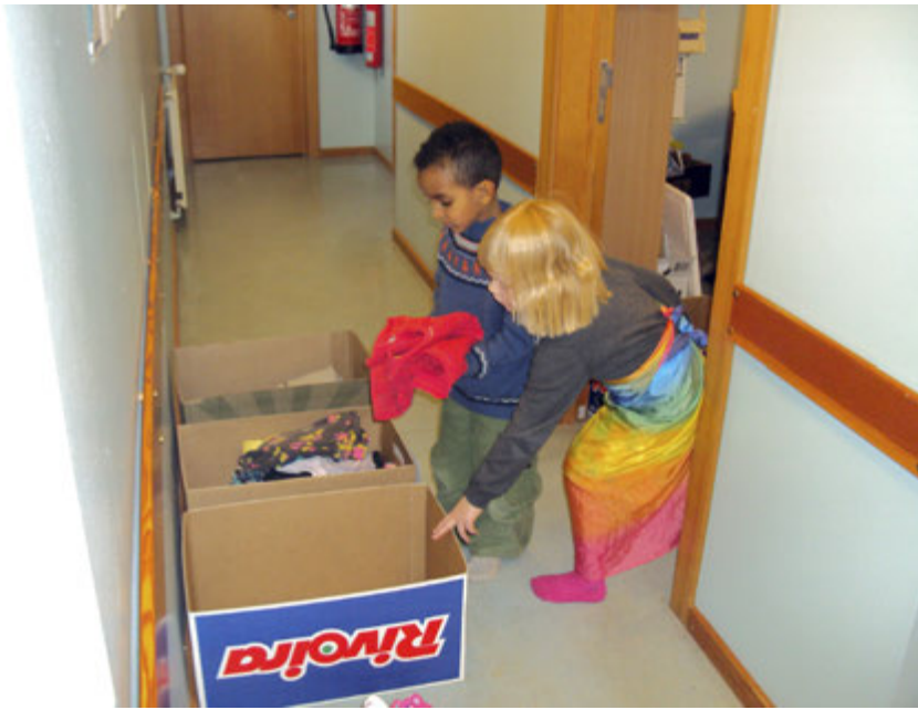
Elstu börnin að raða fötum í kassa fyrir fatamarkaðinn

gjöf en hún má ekki vera of dýr og ekki of stór því það kostar mikið að senda pakka til Argentínu. Þá læra þau líka smám saman að það er ekki hægt að senda hvað sem er. Börnin búa svo til afmælistkort, pakka gjöfinni inn og fara svo með pakkann á pósthúsið.“