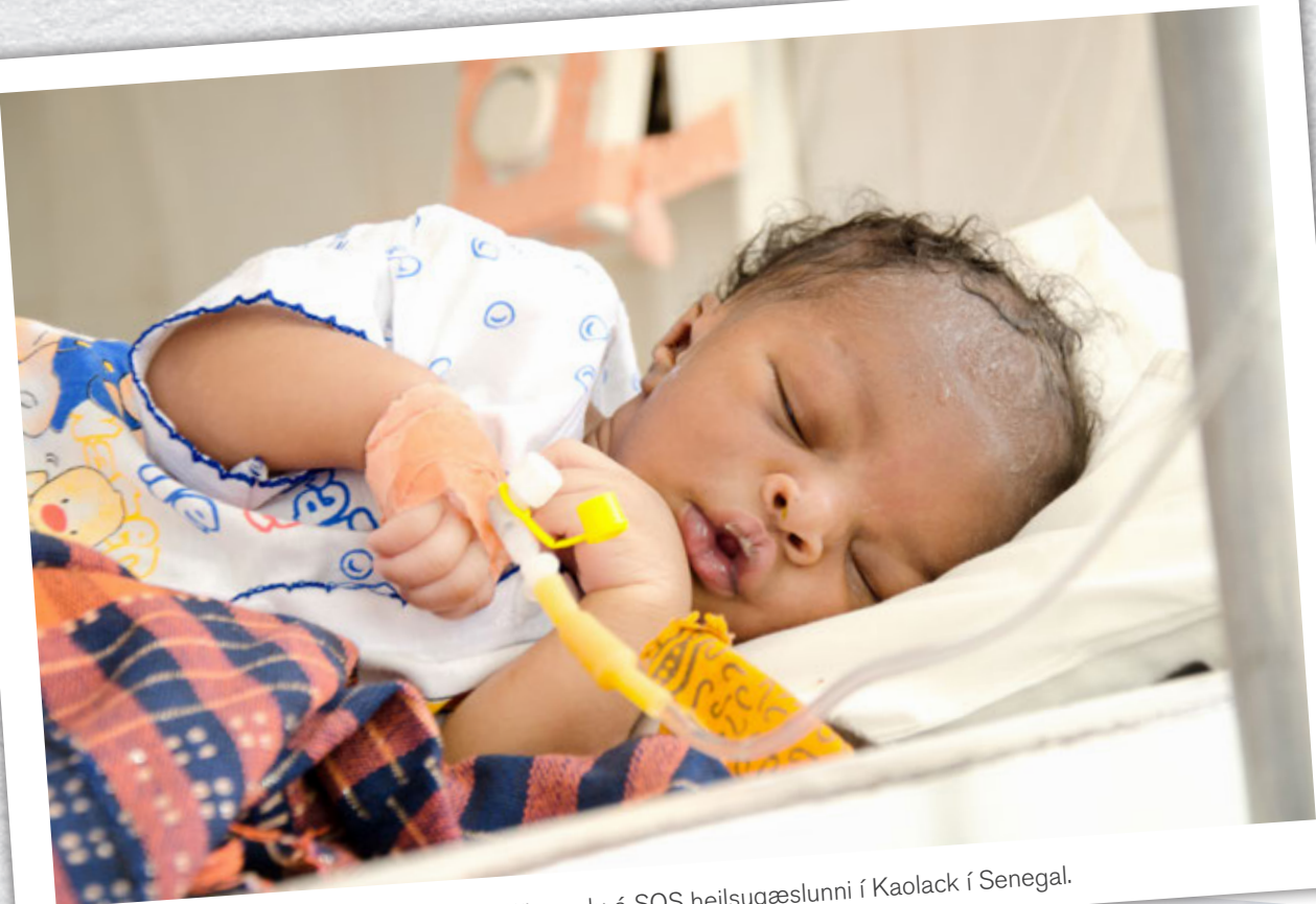
Ungabarn liggur á gjörgæslu á SOS heilsugæslunni í Kaolack í Senegal.