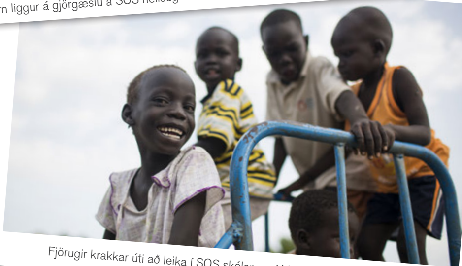
Fjörugir krakkar úti að leika í SOS skólanum í Malakal í Suður Súdan.