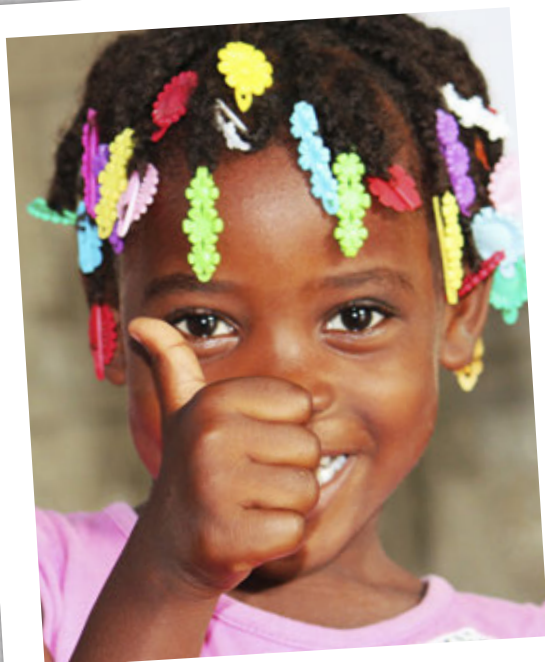
Þessi glæsilega stúlka býr í SOS Barnaborpi í Laos.