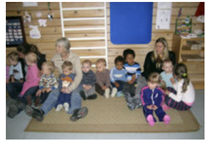
Frá samverustund í Álfaheiði

með ástarkveðjum. Það varð úr að við sendum honum bók með teikningu frá hverju barni og jákvæðar hugsanir fylgdu með. Þetta kennir börnunum að það þarf ekki alltaf að kaupa heldur er líka hægt að gefa frá sér á annan hátt.“