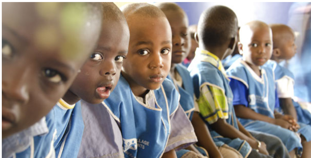
Beðið eftir kennslustund. Þessir nemendur eru í SOS skólanum í Louga í Senegal.