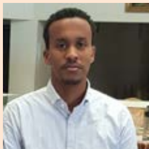
Fyrrum þátttakandi, nú fyrirtækjaeigandi í Mogadishu.