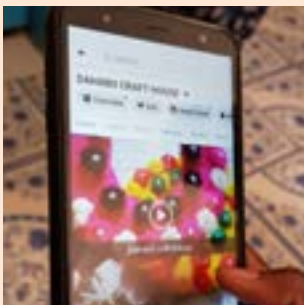
Facebook síða fyrirtækis sem selur handverk.