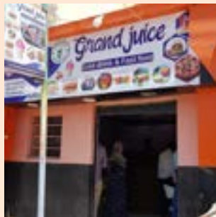
Fyrirtæki sem einn frumkvöðullinn stofnaði.