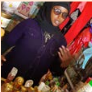
Ung kona sem stofnaði verslun.

Verkefninu lýkur í árslok 2021. Þú getur lagt því lið með því að leggja þitt framlag á reikning: 334-26-52075. Kennitala 500289-2529. Skýring: Sómalía.