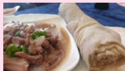
Injera er megin uppistaðan í eþíópískri matargerð. Bakstur og sala á Injeru er algeng tekjulind.

VERTU FJÖLSKYLDUVINUR - SKRÁNING Á SOS.IS